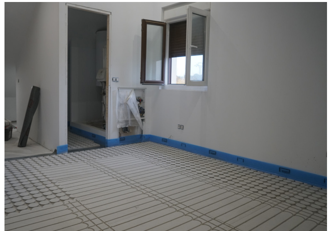
3.- Colocar la placa base con la curva hacia la pared y fijarla en varios puntos con adhesivo a la solera.