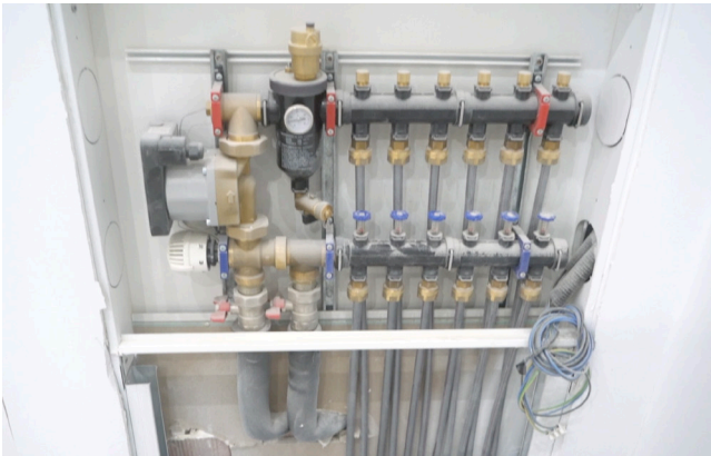
1.- Recibir la caja con el distribuidor.