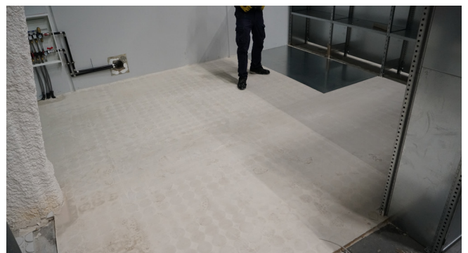
7.- Hacer la prueba de presión