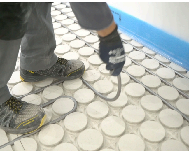
6.- Colocar el tubo de los distintos circuitos