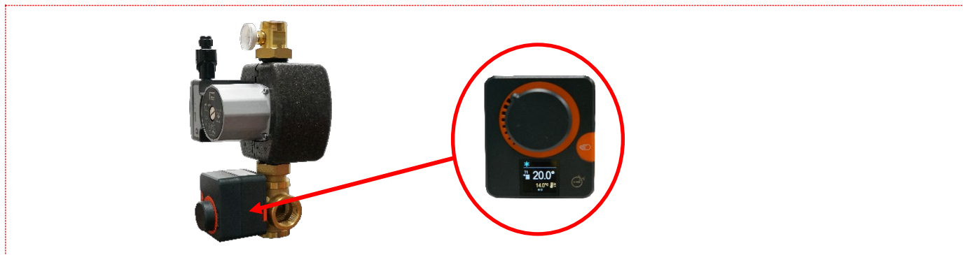
Foto del producto