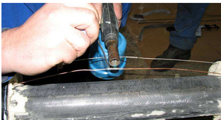
Soldar los conectores mediante estaño