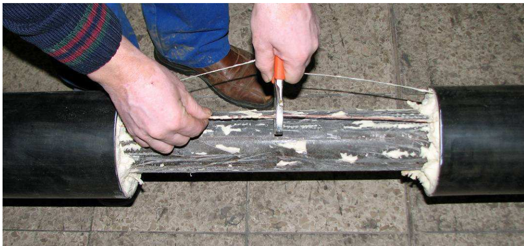
Acortar los cables de detección