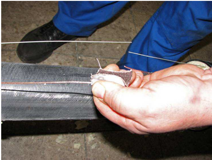
Lijar los cables de detección