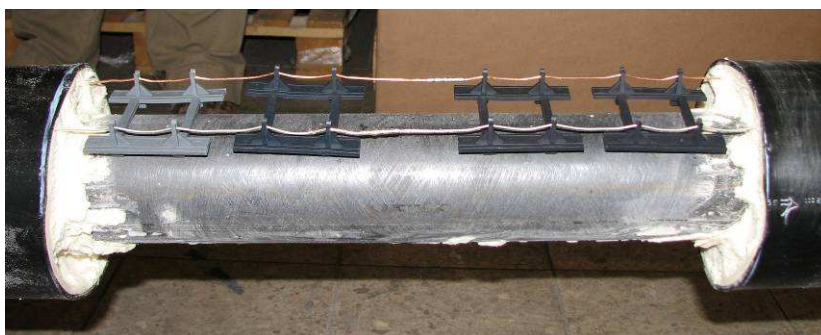
Montar las fijaciones aislantes de los cables de detección